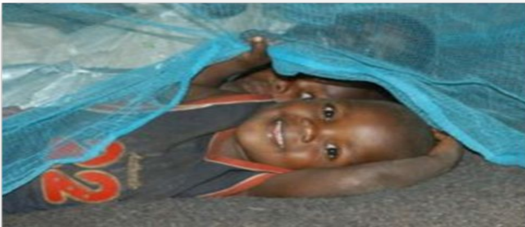
Promotion de l'utilisation des MILDA