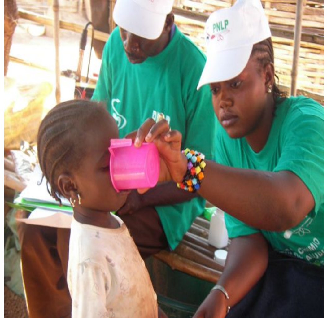
Chimio prévention du Paludisme Saisonnier chez les enfants de 3-59 mois